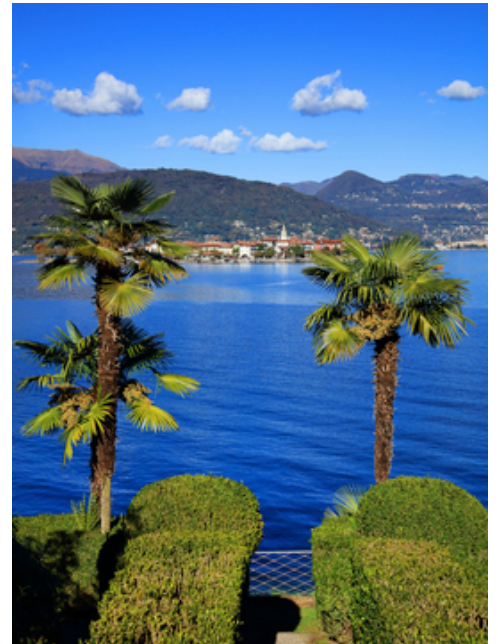
Italien Lago Maggiore